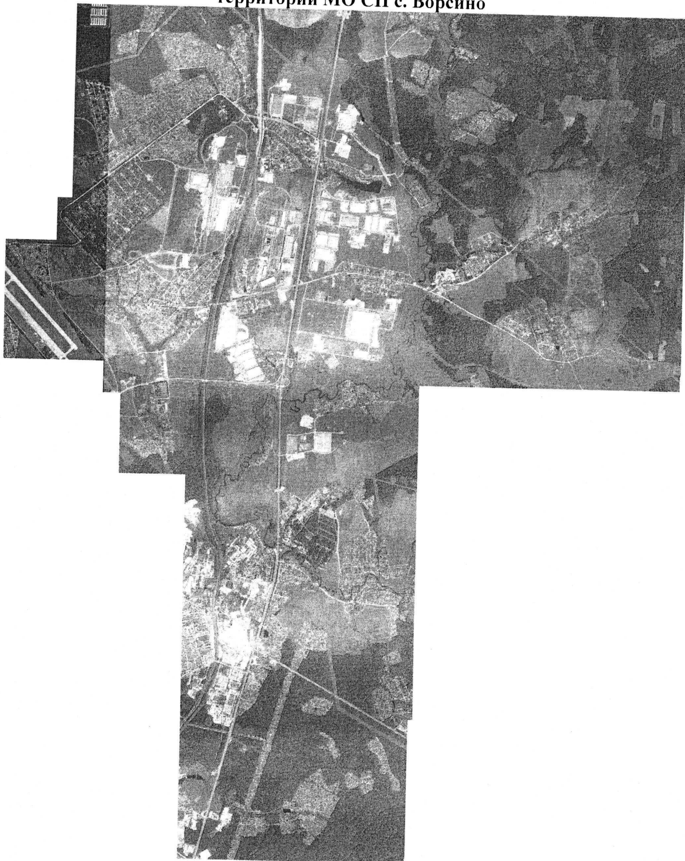
СХЕМА размещения мест (площадок) накопления твёрдых коммунальных отходов на территории МО СП с. Ворсино

Приложение № 2 к постановлению администрации муниципального образования сельского поселения село Ворсино от «21» ноября 2022 г. № 470